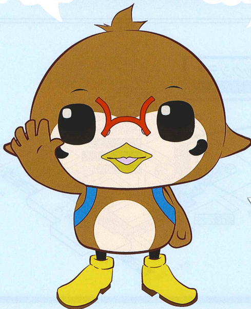
埼玉司法書士会公式キャラクター 法チュン