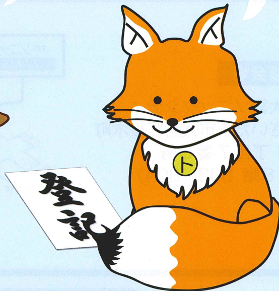
不動産登記推進イメージキャラクター 「トウキツネ」